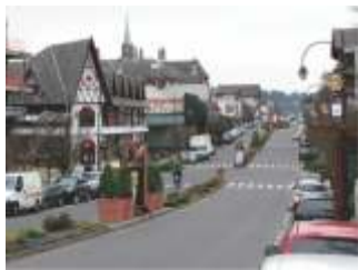
Gramado - RS

Viajando pela região sul, ela oferece atrações para todas as idades. Programas românticos como jantar a luz de velas, passeio de pedalinho no Lago Negro ou um tour pelos bosques e cascatas da vizinha Canela. Para crianças, os parques temáticos - destaque para a Aldeia do Papai Noel e o Mini Mundo - tomam conta da programação. Independente da idade, não se pode deixar de lambuzar com os deliciosos chocolates produzidos na região, saborear sem culpa um farto café colonial e torrar a carteira enquanto bate perna em meio às lojas da Avenida Borges de Medeiros e dos cafés da Rua Coberta.