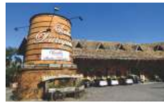
Santa Felicidade - Curitiba

a mata nativa, um lago com carpas, uma cascata de 10 metros e várias espécies de aves.