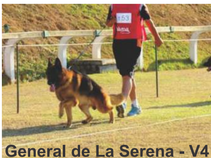
General de La Serena - V4

Primeiramente, gostaria de esclarecer ao leitor o que é e como se desenvolvem às competições de cães Pastores Alemães no Brasil e no mundo.