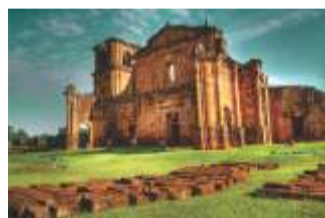
São Miguel das Missões - RS

A culinária sulina recebeu influência dos países que fazem fronteira (Argentina, Paraguai e Uruguai), sendo o churrasco um dos principais pratos derivadas dessa aproximação.