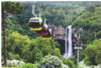
Canela - RS

Gramado terá neve o ano inteiro! Tudo por conta do parque Snowland, primeiro parque de neve indoor das Américas, inaugurado em outubro de 2013. O espaço recria um vilarejo alpino, com direito a pista de esqui e snowboard indoor. Para quem não tem prática, uma escola atenderá a visitantes de todas as idades.