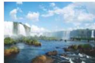
Foz do Iguaçu - PR