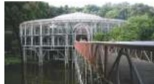
Ópera de Arame - Curitiba

rani dos Sete Povos das Missões, localizado na Região Noroeste do Estado, constituindo um dos conjuntos de arqueologia histórica mais importantes situados em terras brasileiras. Estas evidências materiais da singular civilização resultante do convívio do jesuíta europeu com o indígena provem do início do século XVII, época da fundação dos Sete Povos e, especificamente, da criação do povo de São Miguel. Sua instalação definitiva só se dá, no entanto, em 1687, já que, devido aos ataques dos bandeirantes, esta redução teve que ser transferida para outra margem do Rio Uruguai, só sendo efetivada sua instalação no sítio atual quando cessaram as investidas paulistas.