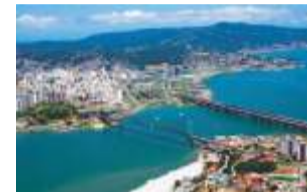
Florianópolis - SC

Itaipu, encantam qualquer visitante. Além desses atrativos, outras opções compõem a oferta turística. São atrativos naturais, culturais, compras, atividades esportivas e variadas que fazem com que o Destino Iguaçu seja destaque nacional e internacional.